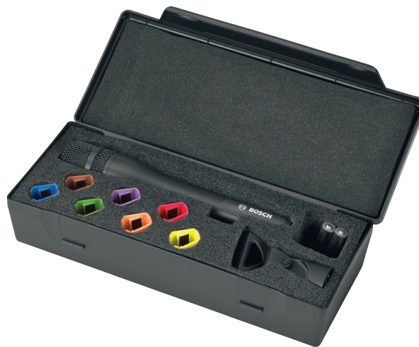
Futerał ochronny na mikrofon bezprzewodowy, ręczny i akcesoria