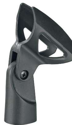
Szczegółowy widok uchwyty mikrofonu